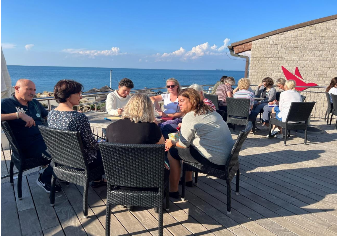
A középső napon egy számunkra még ismeretlen munkaformát tapasztalhattunk meg, ez az úgynevezett „Open space” volt.