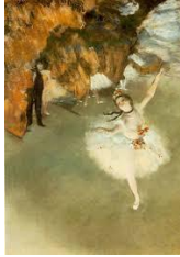
d, La danseuse sur la scène

30. Mi az idei párizsi olimpia kabalája?