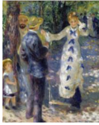
c, La balançoire